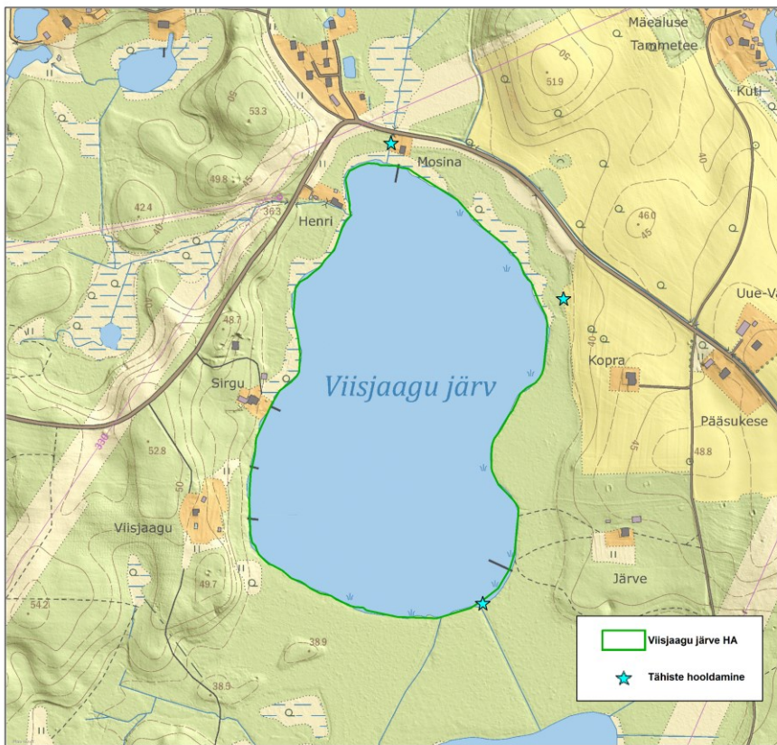
Joonis 2. Tähiste hooldamine Viisjaagu järve hoiualal ( aluskaart: Maa-amet 2022 ).